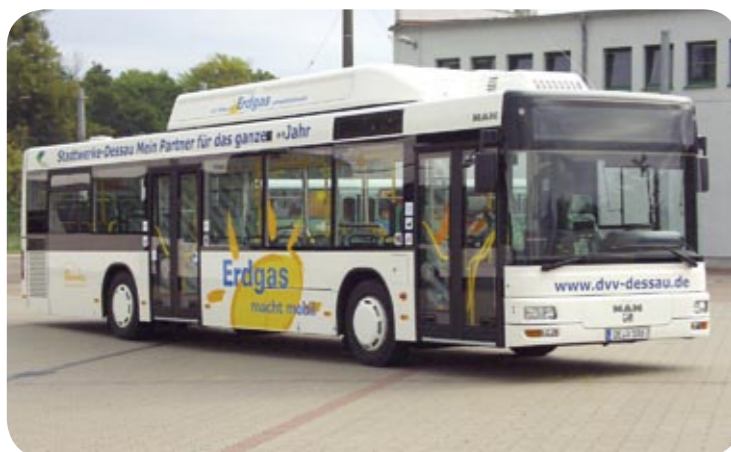
Die Stadtwerke Dessau engagieren sich mit zwei Erdgastankstellen für den Einsatz von Erdgas als Kraftstoff. Darüber hinaus betreibt die Dessauer Verkehrs GmbH bereits seit dem Jahr 2001 20 moderne Erdgas-Niederflurbusse und entlastet damit die Umwelt im Vergleich zum Dieselflurbetrieb erheblich.