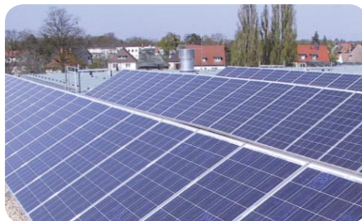
Aus Sonnenlicht wird Strom: Auf dem Dach des Technologie- und Gründerzentrums in Dessau-Ziebigk betreiben die Stadtwerke eine Photovoltaik-Anlage.