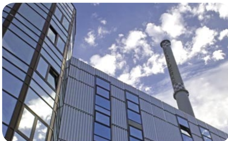
Mittels Kraft-Wärme-Kopplung entstehen im Kraftwerk Dessau Strom und Wärme – hocheffizient und mit geringerer Umweltbelastung.