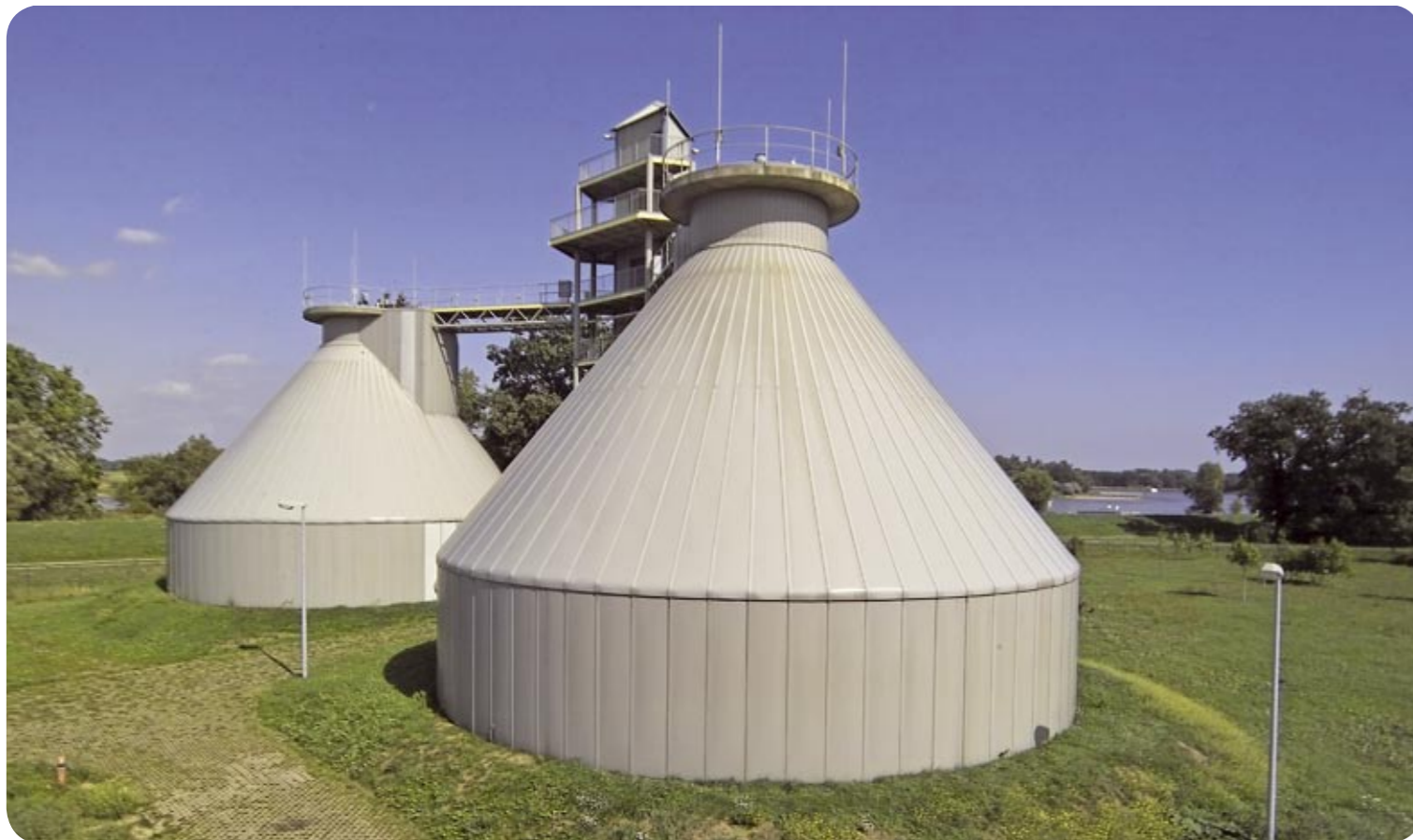
In den Faultürmen der Kläranlage wird mit dem anfallenden Klärschlamm Gas erzeugt, das im eigenen Blockheizkraftwerk verbrannt wird. Die Abwärme dient zur Beheizung der Faultürme und des Betriebsgebäudes.